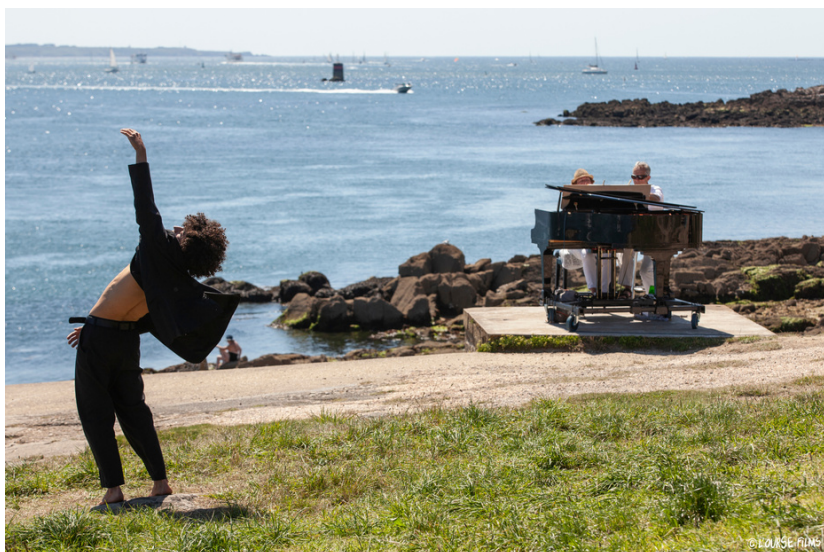
Danse au Large