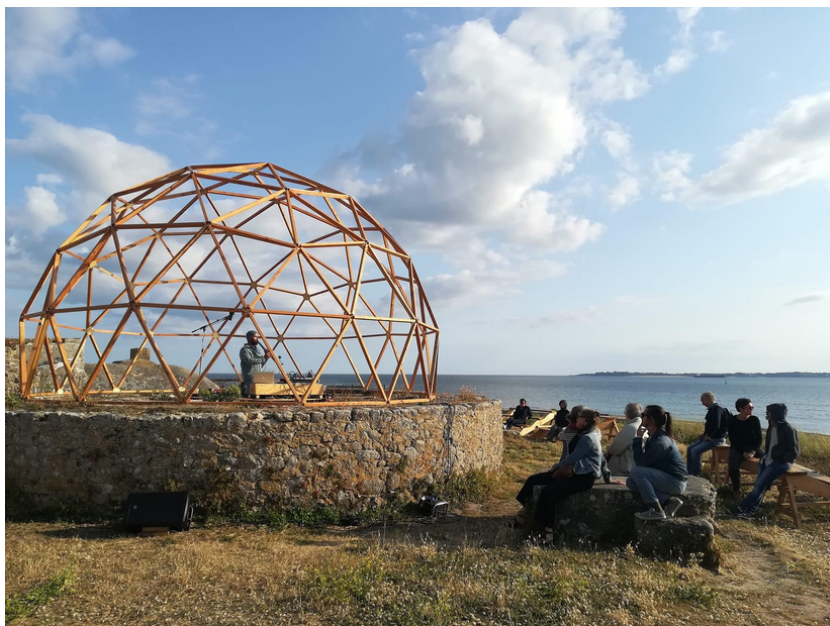
Campement artistique pour littoral, Gâvres, juin 2023

C.A.M.P - Capsule Artistique en Mouvement Permanent, est une invitation à se tourner vers l'espace public. Cette structure n'a pas de murs mais elle agit sur un lieu : son territoire. Nous pouvons donc partir du principe que les parcs, les places, les plages, les écoles, les piscines, les monuments, les édifices, la mer, les rues... qui sont à l'intérieur de ses frontières deviennent son terrain d'occupation.