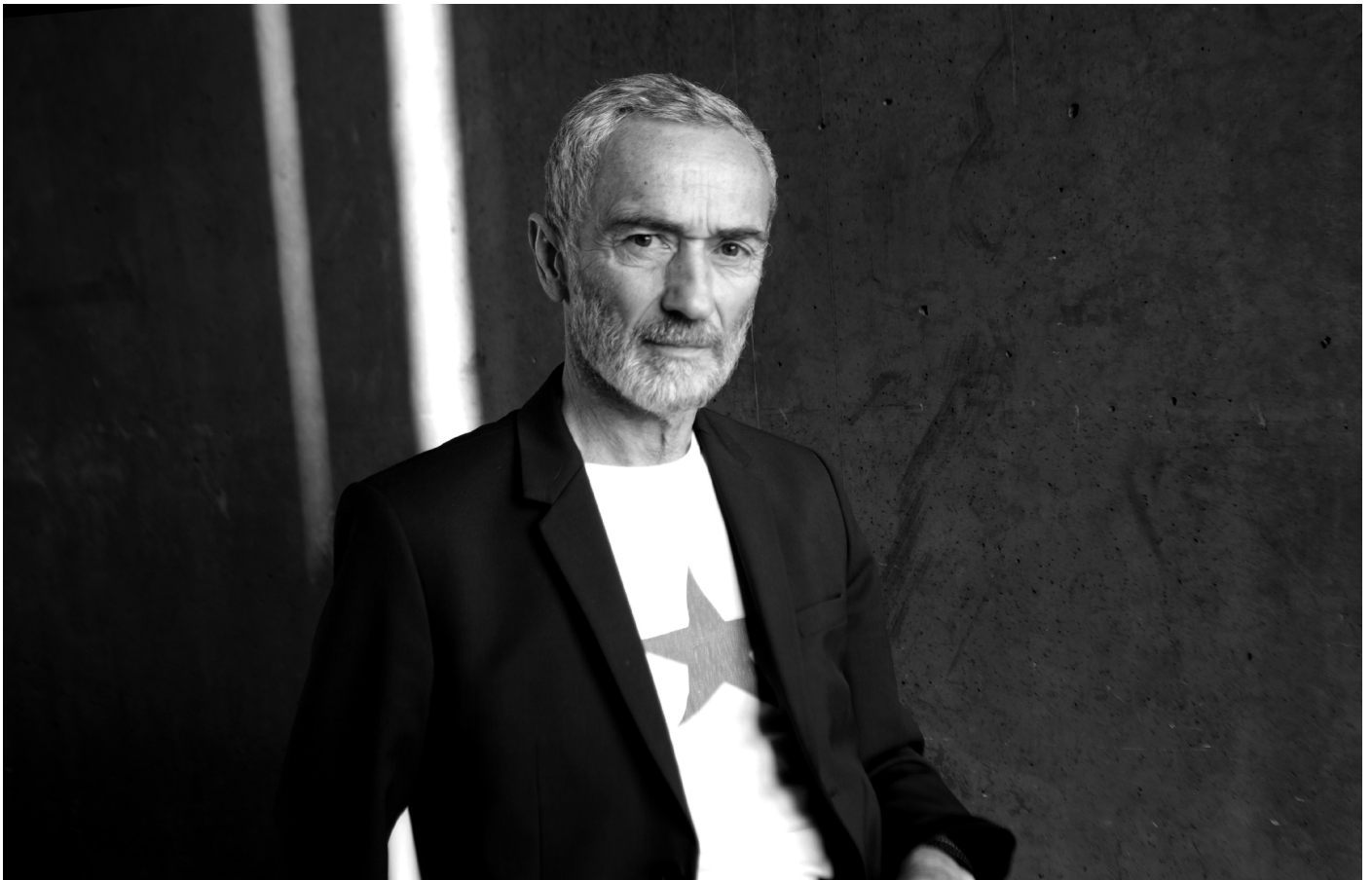
Angelin Preljocaj

La représentation des masculinités abordée dans l'exposition « Gustave Caillebotte Peindre les hommes » se prolonge sur la scène de l'auditorium avec cette conférence d'Angelin Preljocaj. Elle sera suivie par une projection du film de Cyril Collard réalisé à partir des Raboteurs , avec une chorégraphie d'Angelin Preljocaj.