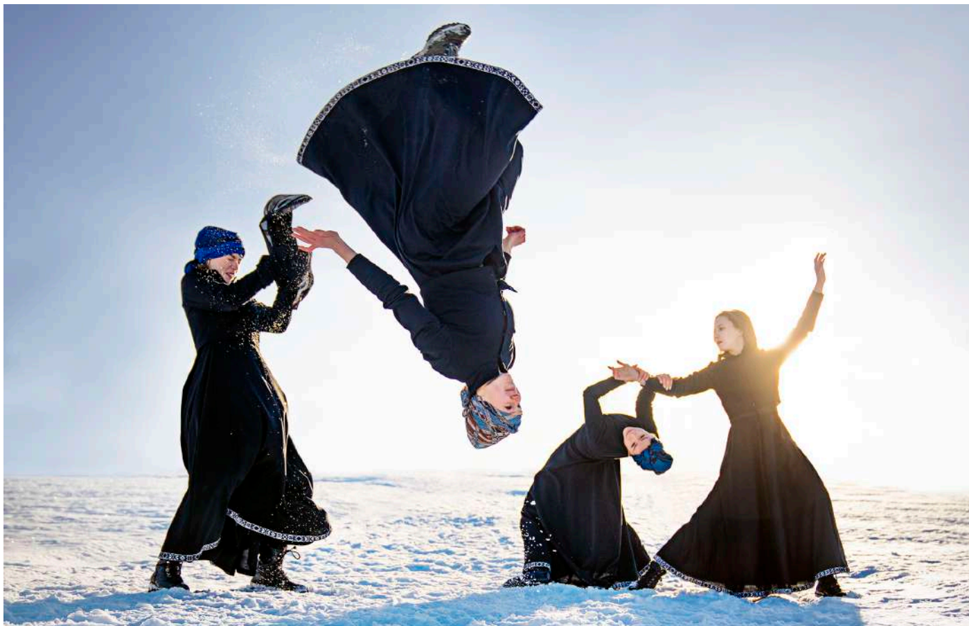
Skaut © Hallgrim Hansegård

En écho à l'exposition « Harriet Backer (1845-1932), la musique des couleurs », le musée d'Orsay programme le festival « Norvégiennes en scène » qui propose d'explorer la richesse des voix des artistes norvégiennes d'aujourd'hui : le chorégraphe Hallgrim Hansegård met en scène les danseuses de Skaut dans un dialogue entre répertoires contemporain et traditionnel.