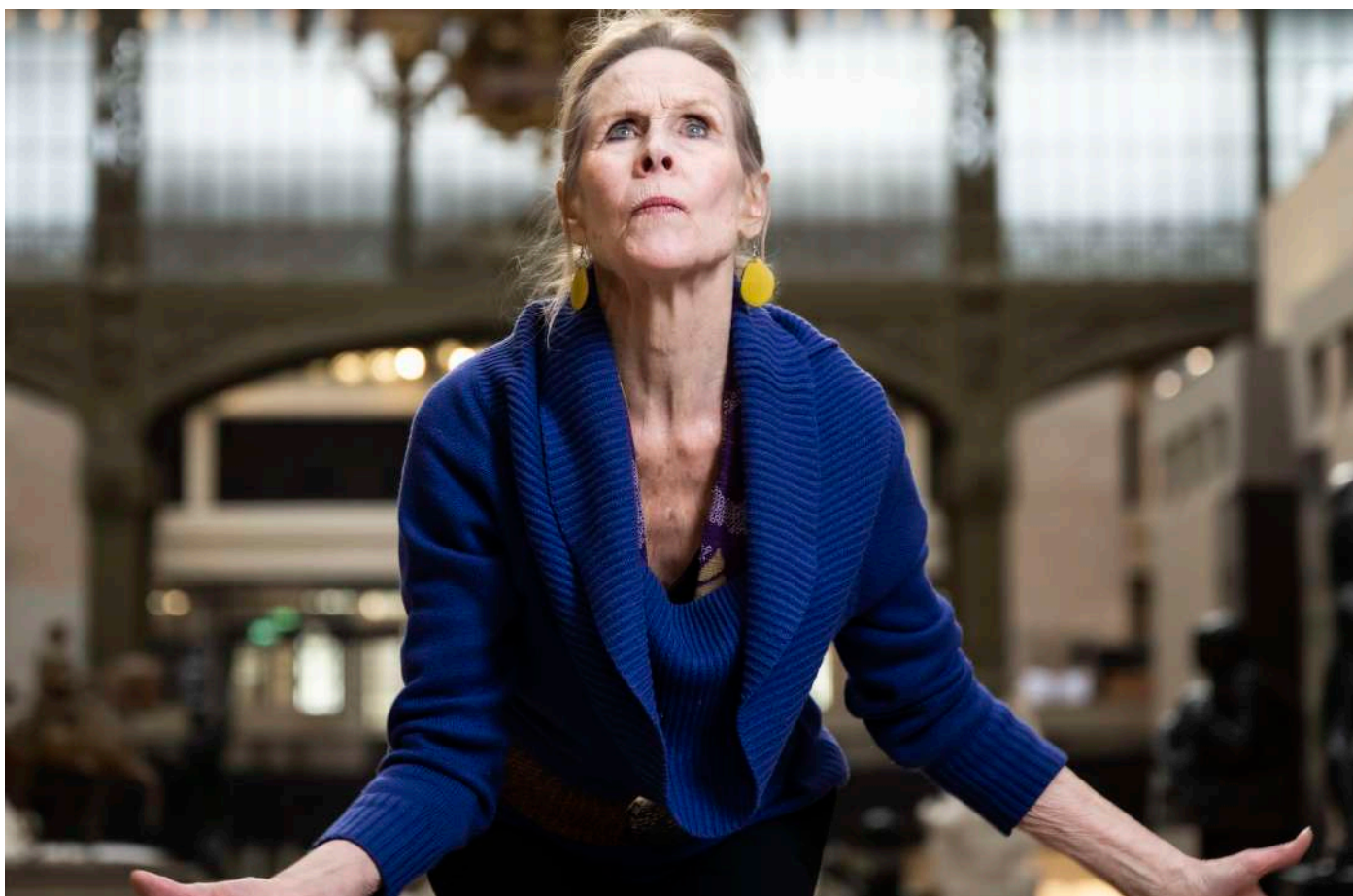
Carolyn Carlson

Carolyn Carlson, figure emblématique de la danse contemporaine, accompagnera nos musées tout au long de la saison. Au mois de septembre 2024, elle ouvrira le cycle « Danse dans les Nymphéas » avec sa pièce Poetry Events , qui mêlera poésie, musique et arts graphiques pour un voyage unique au cœur des Nymphéas. En juin 2025, elle proposera une traversée de son répertoire chorégraphique dans la grande nef du musée d'Orsay. En point d'orgue, la participation d'Hugo Marchand, danseur étoile de l'Opéra de Paris et interprète d'un solo, Sunlight under Water , spécialement conçu pour lui par la célèbre chorégraphe, lors d'une première mondiale.