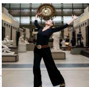
Carolyn Carlson