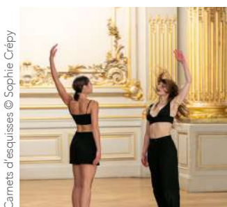
Carnets d'esquisses