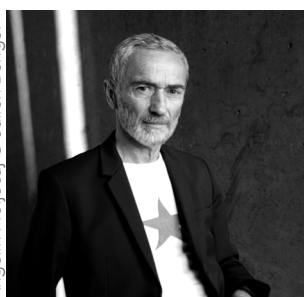
Angelin Preljocaj