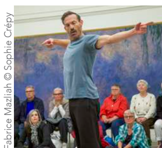
Fabrice Mazliah