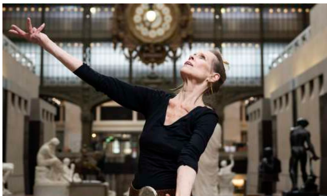
Carolyn Carlson

Unique dans le champ de la danse contemporaine, la chorégraphe développe depuis de nombreuses années une forme particulière, à la croisée de ses différentes expériences artistiques, les Poetry Events .