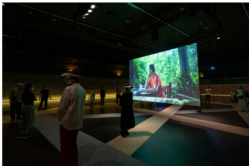
A Conversation with the Sun (VR) , Apichatpong Weerasethakul, Aichi Triennale 2022

Avec le soutien de : the Agency for Cultural Affairs, Government of Japan, Japan Arts Council