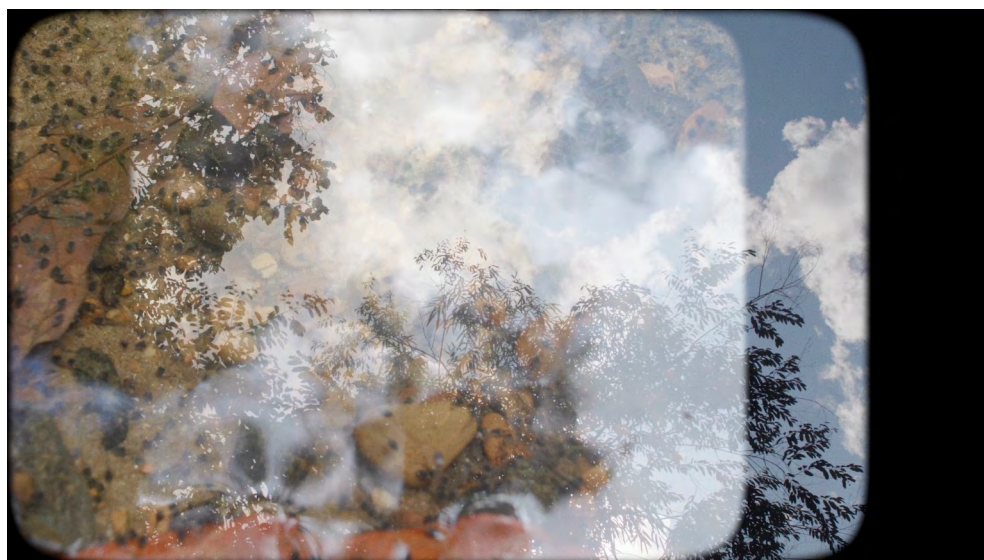
For Bruce, Apichatpong Weerasethakul, installation video, 2022

Dans le jardin de l'Atelier Brancusi, Apichatpong Weerasethakul présente une installation sonore à ciel ouvert créée spécifiquement pour le site à partir de ses matériaux de rêves.