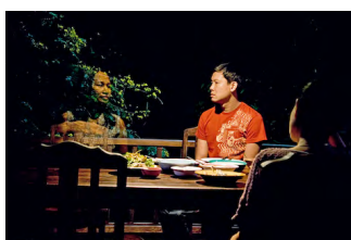
Uncle Boonmee , Apichatpong Weerasethakul, 2010