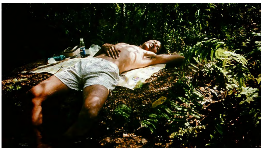
Blissfully Yours , Apichatpong Weerasethakul, 2002

Le Centre Pompidou présente la rétrospective intégrale des films et vidéos d'Apichatpong Weerasethakul : ses huit longs métrages, la trentaine de films courts (et rares) qu'il a réalisés, des œuvres collectives et deux longs métrages dont il est producteur.