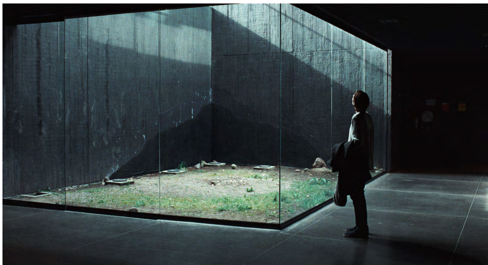
Memoria, Apichatpong Weerasethakul, 2021